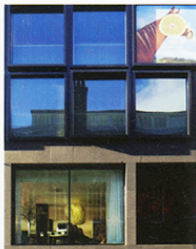
Concrete realiseerde onlangs het derde citizenM-hotel in Glasgow. Het hotel bestaat uit 215 geprefabriceerde kamers van 14 m 2 , uit-gerust met 'en groot bed en een eenvoudige adkamer.

De vette hotels die we mogen ontwerpen in Amerika, compenseren we met een stripteasetent in opdracht van een ondernemer hier op de Wallen. Daarnaast maken we voor de moederorganisatie van de Supperclub nog steeds veel restaurants in binnen- en buitenland.