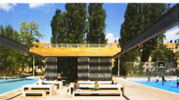
Het Van Beuningenplein is ingericht als woonkamer van de buurt. Het bestaat uit verschillende open ruimtes die zijn bestemd voor specifieke activiteiten en leeftijden.

praktijk ontwikkelen. Op school verzamel je alleen kennis en daar heb je betrekkelijk weinig aan. Voor het rebelse in mensen moet ook op school veel ruimte zijn. Ik wilde op de Academie Ikea analyseren in plaats van een museum. Dat vonden de docenten toen vervelend, terwijl Ikea veel eerder maatschappelijke ontwikkelingen in haar interieurs oplost dan het Rijksmuseum doet.